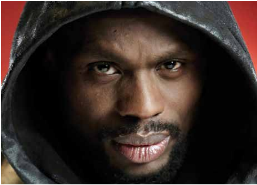
Chef de file du «rap conscient», Kery James est parrain des jeunes Villeneuvois en 2015.

La Ville, engagée dans une démarche de valorisation de parcours et de réussites des jeunes, a le plaisir d'accueillir le 9 mai prochain, Kery James en concert acoustique.