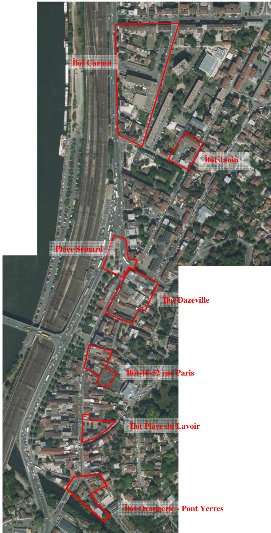
Figure 3 : Le périmètre de la ZAC multisite, EPA ORSA