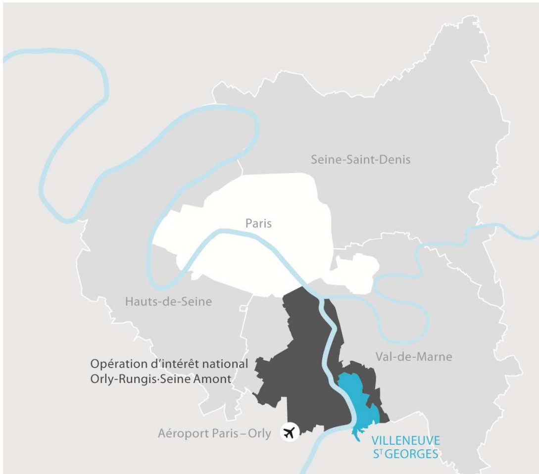
Figure 1 : Localisation de Villeneuve-Saint-Georges en Île-de-France