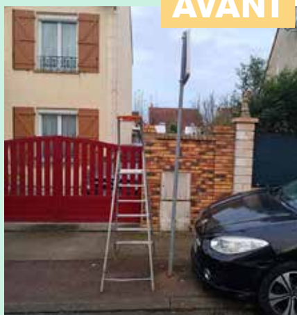
Installation de mobilier urbain