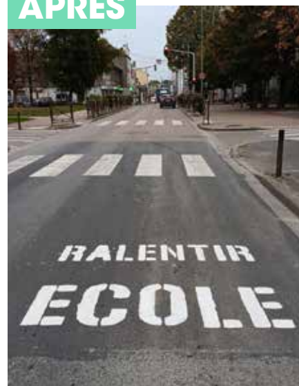
Entretien des voiries