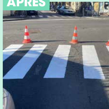
Marquages au sol