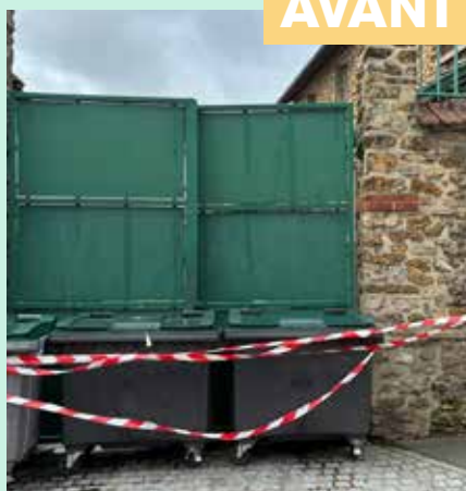
Réparation du mobilier urbain