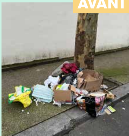
Ramassage des déchets