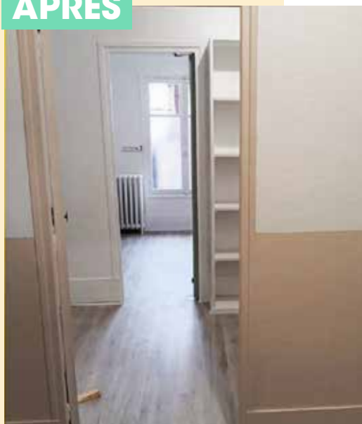
Travaux dans les écoles