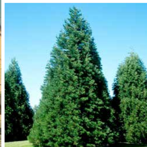
Un séquoia de cette essence et de cette taille sera bientôt planté devant l'Hôtel de Ville.